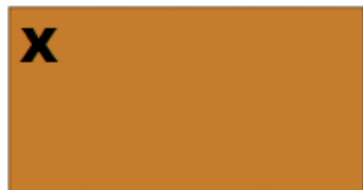
maïsgelb ■ corn yellow ■ кукурузно-желтый Art.-No. 3612