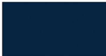
königsblau ■ royal blue ■ королевский синий Art.-No. 3603